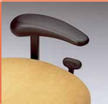
maniglia a T per azionamento del freno