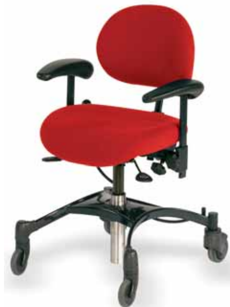
VELA Tango 100 con molla a gas

La serie VELA TANGO 100 è disponibile in due esecuzioni standard: