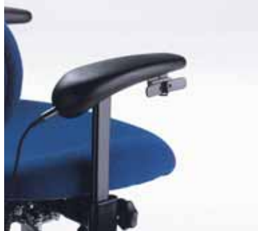
maniglia per ammalati di gotta e reuma con contatto a pressione