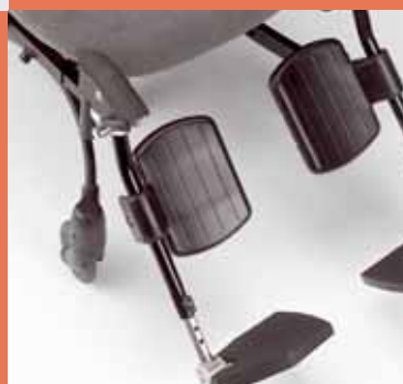
sostegno per gambe, regolabile elettricamente