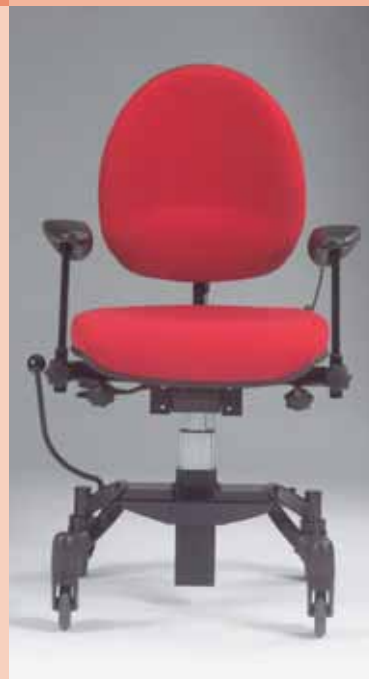
Vela Tango 300

Ambedue i modelli possono essere forniti con sedile per persone che hanno subito un intervento di artrodesi.