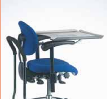
tavolino in materiale acrilico