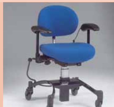
VELA Tango 100A con molla a gas e seduta per per persone che hanno subito un intervento di artrodesi.