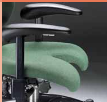
rivestimento sedile per incontinenti

VELA offre un'ampia scelta di accessori: