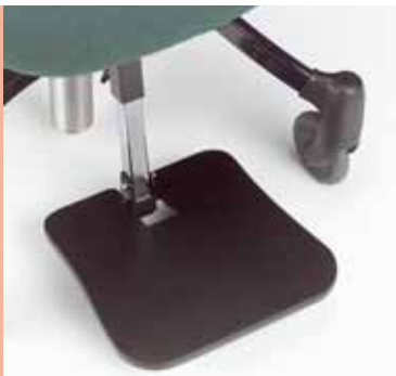
piastra per sostegno piedi S