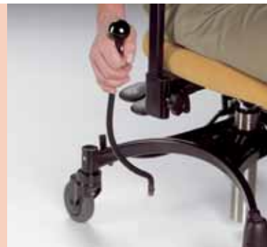
prolunga per freno