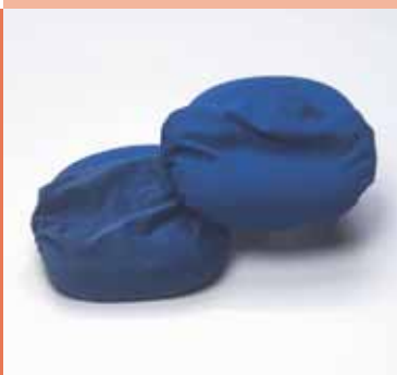
rivestimento di protezione per sedile